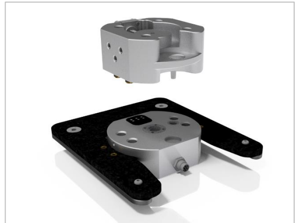
Abbildungen enthalten Zusatzausstattung